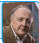
Table ronde 1 Insertion professionnelle