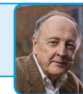
Table ronde 1 Habitat