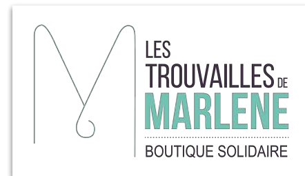
Conception d'un logo