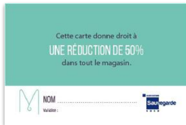
La Carte Privilège